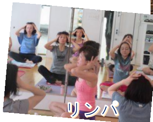
リンパ コンディショニング