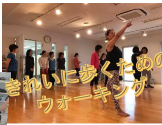
きれいに歩くための ウォーキング